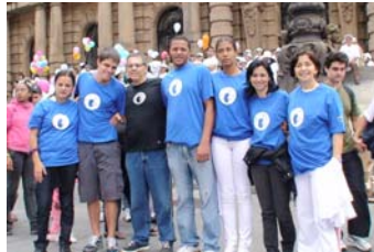
Nefrologistas da SONESP e SBN juntos na Caminhada.