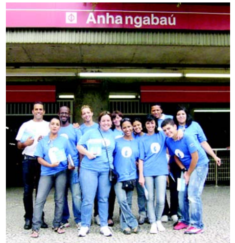
Equipe da SONESP em atendimento no metrô Anhangabau.

As atividades só foram possíveis por conta das parceiras que aumentaram com a vinda de Associação Comercial de São Paulo, do Rotary Club Butantã e do Lions Club Suzano (ver na página 8 calendário das próximas atividades da campanha agendadas até o final do ano).